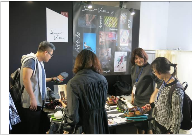
Sweet Villians 攤位洽談