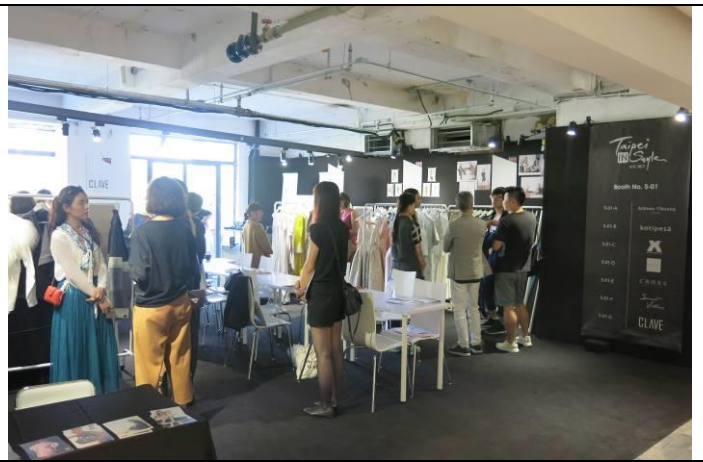
Taipei IN Style 台灣品牌區 吸引買家媒體參訪